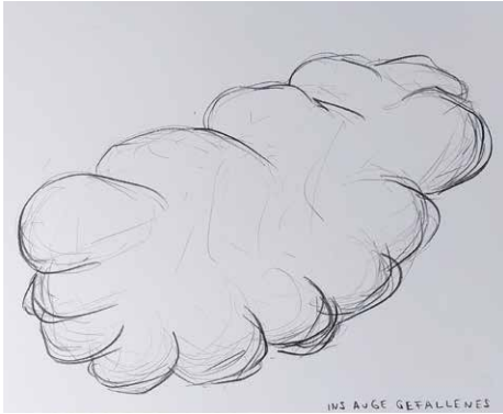
Ins Auge Gefallenes , aus der Serie: unwillkürlich, Bleistift auf Papier, 2020 © VG Bild-Kunst, Bonn 2021