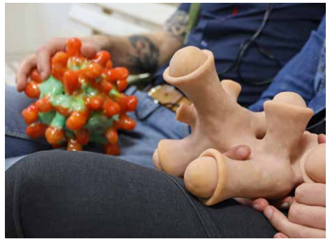
Installationsansicht Sexuelles Vegetieren , Installation, Galerie Weisser Elefant Berlin, 2019

dass das Gegenüber dem Wesen verfällt und sich ihnen lustvoll hingibt. Die durch Kopfhörer zu hörenden Texte geben darüber Auskunft, wie die Fortpflanzung geschieht und lässt eine ungewohnte Intimität entstehen, die auch räumlich durch abgegrenzte Separees unterstrichen wird. Fiktion und Realität werden hier stark vermischt und sollen zum Nachdenken über zukünftige Mischformen nachdenken, gleichzeitig aber auch den Herrschaftsanspruch des Menschen gegenüber der Natur in Frage stellen.