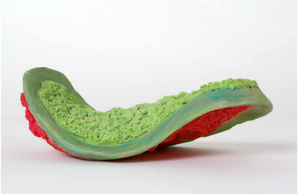
00016 amoenus vagans (formwechselnder reizvoller)

Die Fortbewegung dieser Organismen findet in wellenartigen Kontraktionen statt. Die Individuen bewegen sich bei warmem, feuchtem Wetter auf erhabene, sonnige Stellen und verkriechen sich bei schlechter Witterung in Erdspalten. Häufig versammeln sich die Organismen zu ungeheuer großen, teppichbildenden Gruppen. Zur Kommunikation können sie elektrische Reize über eine Vielzahl einzelner Organismen hinweg senden. So ist ein blitzartiger, effektiver Informationsaustausch innerhalb sehr großer Gruppen möglich. Diese Lebewesen sind Ditritusfänger.