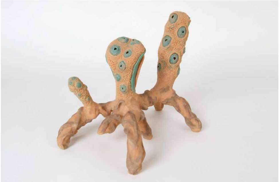
00005 caecus occultus (verborgener blinder)

Die Kombination von eu- und prokaryotischen Zellverbänden ermöglicht caecus occultus eine eigenartige Beweglichkeit. Die Verbindung von pflanzlichen und tierischen Zellstrukturen führt zu einer divers ausgebildeten Leibesmasse. Im Magen faulende Substanz wird stets mit Sauerstoff versorgt und bildet einen Intrakosmos, indem beständig aus den Abbauprozessen freiwerdende Energie in den umgebenden Körper abgegeben wird.