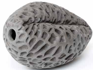
Pollenstudie, Institut für postevolutionäre Lebensformen, 2021, Keramik © VG Bild-Kunst, Bonn 2021

Übrigens: Der Grund für allergische Reaktionen während der Pollenflugzeit liegt an der chemischen Struktur von Eiweißen, die um das Sporoderm gelagert sind, und die als Botenstoff für die Pflanze fungieren. Trifft der Pollen mit den männlichen Erbanlagen auf die Narbe der Blüte entwachst dem Pollen ein sogenannter Pollenschlauch, der die Keimzellen zum Fruchtknoten bringt und so männliche und weibliche Keimzellen zusammenbringt.