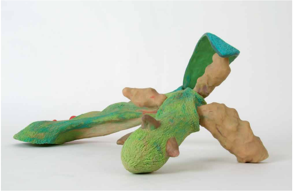
00043 cauda spiralis (gewundener schwanz)

cauda spiralis kann als Doppelatmerin sowohl im Wasser als auch an der Luft atmen, bewegt sich aber auf der Erde nur humpelnd fort. Dabei stützt sie sich mit Hilfe von Turgorextremitäten. cauda spiralis ist ein Tierstock, der aus einer Gruppe von tierischen Lebewesen hervorgegangen ist. Die Individuen ergänzen sich durch aufeinander abgestimmte Spezialisierung gegenseitig. Die Form zeichnet sich durch hohe Regenerationsfähigkeit aus. Beispielsweise kann sie ganze Körperteile wiederherstellen. Fotosynthese wird über ein chlorophyllhaltiges dorsales