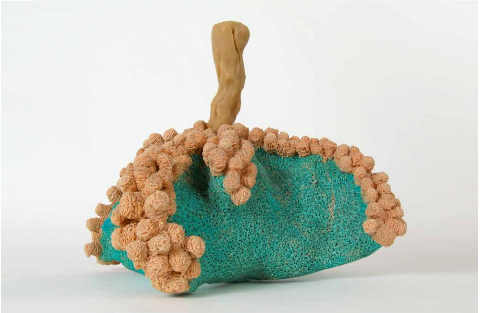
00008 pseudoandronyma phimosus (scheinmännliche verengte)