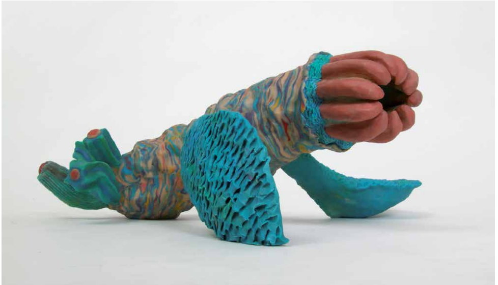
00045 udicola turgida (geschwollene nassbewohnende), verschiedene Materialien, 2006 © VG Bild-Kunst, Bonn 2021

und wie werden diese das Selbstverständnis des Menschen ändern? Denn wenn die Grenzen zwischen den Arten aufweichen, dann wird auch die bisherige Hierarchie in Frage gestellt. Können wir vielleicht Lebewesen entwickeln, die evolutionär so starke Überlebensqualitäten haben, dass sie als postevolutionär gelten? Die fähig sind, die noch kommenden Folgen des Klimawandels zu überleben und damit dem Menschen sogar überlegen sind?