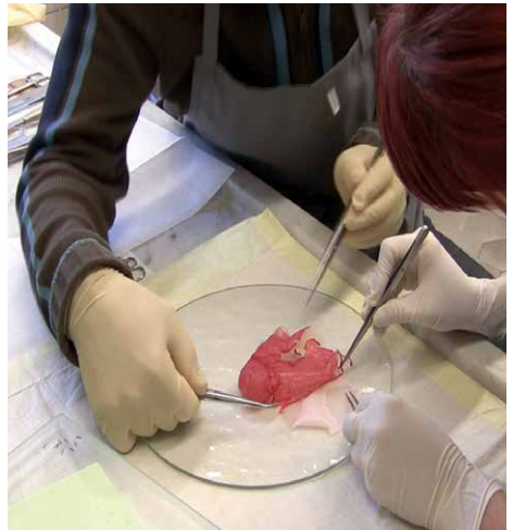
Filmstill aus der Dokumentation zu Jenseits des menschen , 2010/11 © VG Bild-Kunst, Bonn 2021

nur Zellgewebe, sondern ganze Organismen gezüchtet werden können. Und an diesem Punkt beginnt die Selbstpositionierung des Menschen zu bröckeln. Denn wenn wir in Zukunft lebensfähige Organismen aus Menschenzellen gestalten können, muss die Form eines Körperaufbaus, wie wir ihn gewohnt sind, nicht zwingend notwendig sein.