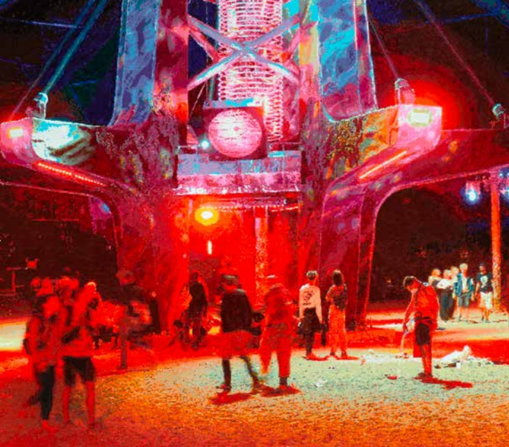
Römer + Römer: Ausklang [Ausschnitt], 2019, Öl auf Leinwand, © Römer + Römer & VG Bild-Kunst, Bonn 2025