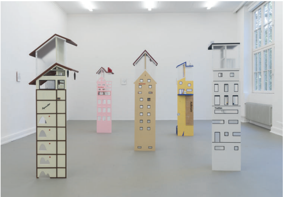
Karla Zipfel: Häuser und Maxime, 2023, MDF, Plexiglas, Holzleim, Acrylfarbe, Fundstücke, © Karla Zipfel & VG Bild-Kunst, Bonn 2026