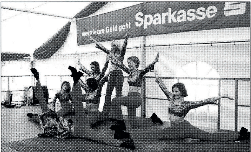
Peter Piller: aus der Serie: Tanz vor Logo , 2000 – 2006, sechs Pigmentdrucke

Bei Tanz vor Logo sehen wir ausnahmslos Frauen in gleichen Bühnenoutfits, die in Turnhallen oder auf Bühnen in Festzelten vor einem unsichtbaren Publikum tanzen. Im Hintergrund prangen Wortmarken, in den