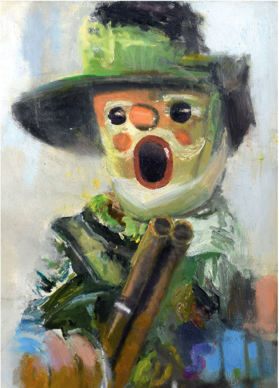
Maximilian Martinez: Räuchermännchen Porträt - Erstes 2 (im Spiegel), 2026, Öl, Acrylbinder, organische und natürliche Pigmente auf Baumwollgewebe, © Maximilian Martinez & VG Bild-Kunst, Bonn 2026