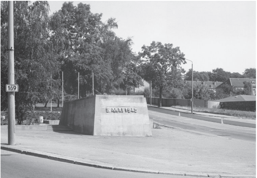
Jens Klein: Trittbrettfahrer der Geschichte, 2015/26, Hier verwendetes Foto: Sockel des ehemaligen Panzerdenkmals zum 8. Mai 1945, nach 1945, Chemnitz, Foto: Schumacher, Klaus-Dieter, 1991, Deutsche Fotothek, Dresden, Postkartenbuch, für diese Ausstellung als Leporello produziert, © Jens Klein