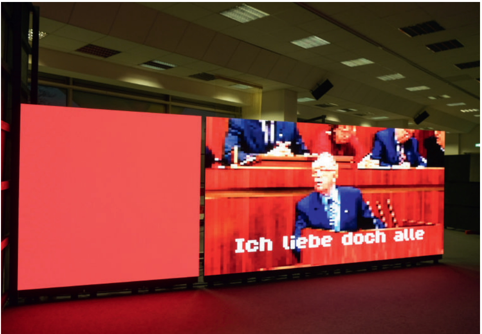
Emanuel Aeneas Megersa und Michael Schlecht: Ich liebe doch alle Menschen , 2024, 2 Kanal-Videoinstallation, © Emanuel Aeneas Megersa