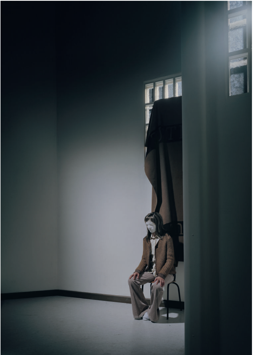
Andreas Mühe: RAF Zelle Stammheim – letzter Vorhang I, aus der Serie: Freitag der 13., C-Print, matt Edition: 1/3+II AP, © Andreas Mühe & VG Bild-Kunst, Bonn 2026