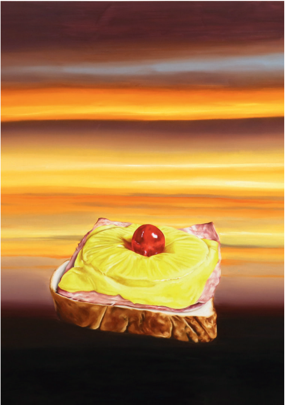
Albrecht | Wilke: Inselfieber , 2024, Öl auf Leinwand, © Albrecht | Wilke