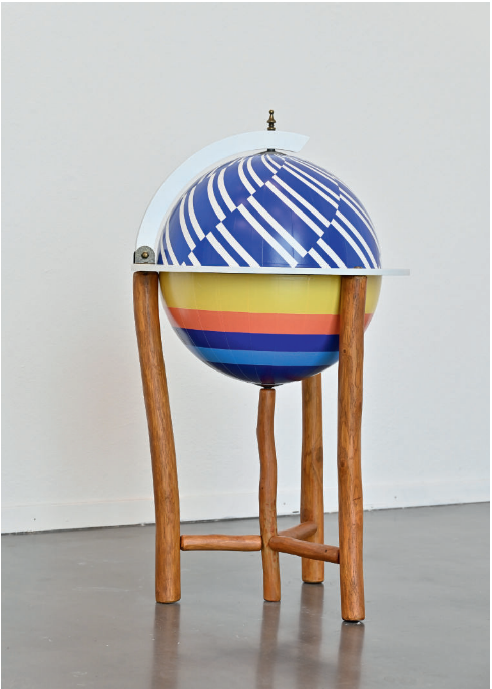
Nicholas Warburg: Ehen in Gummersburg, 2023, Mixed Media