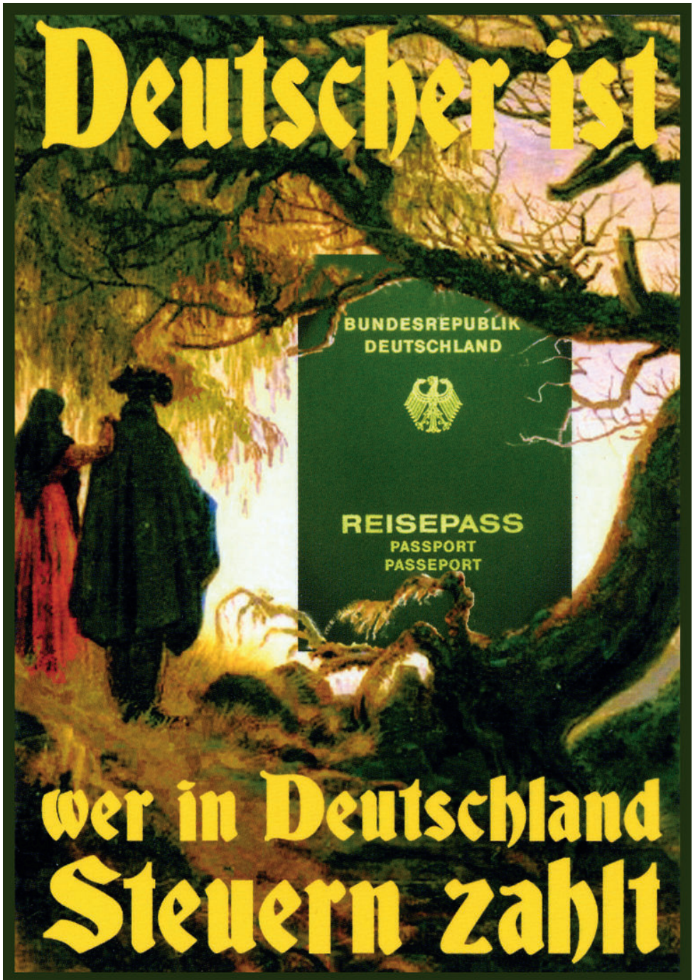
Klaus Staeck: Staatsbürgerschaft, 2000, Edition Staeck, Sammlung Kunstmuseum Heidenheim