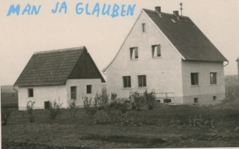
Max Kersting: An irgendwas muss man ja glauben, 2025, gefundene Fotografie, übermalt, © Max Kersting