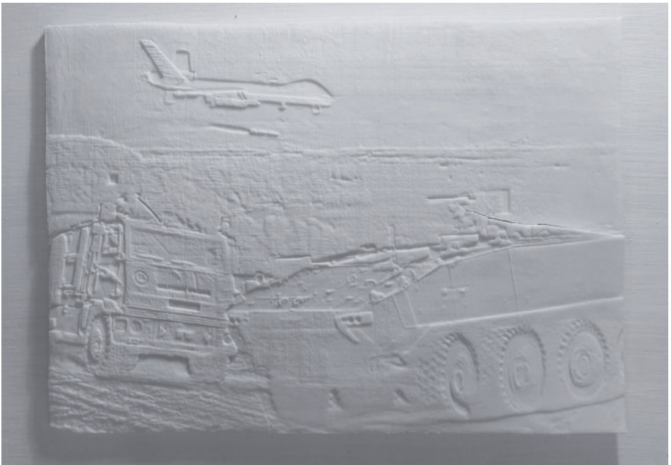
Bianca Patricia Isensee: Grüße vom Bodensee, 2019, Porzellan, © Bianca Patricia Isensee & VG-Bild-Kunst, Bonn 2026