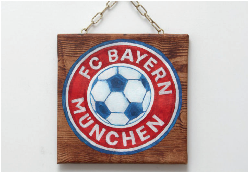
Kai Fischer, aus der Serie: Patria, seit 2024, Acryl auf Leinwand auf Holzrahmen, Kette, © Kai Fischer