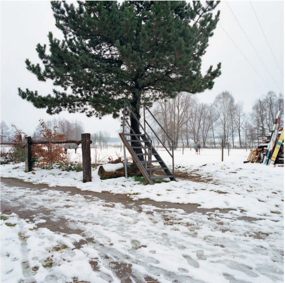
Andy Heller: aus der Serie „räumen“, 2005/6, C-Print, kaschiert und gerahmt, © Andy Heller & VG Bild-Kunst, Bonn 2026