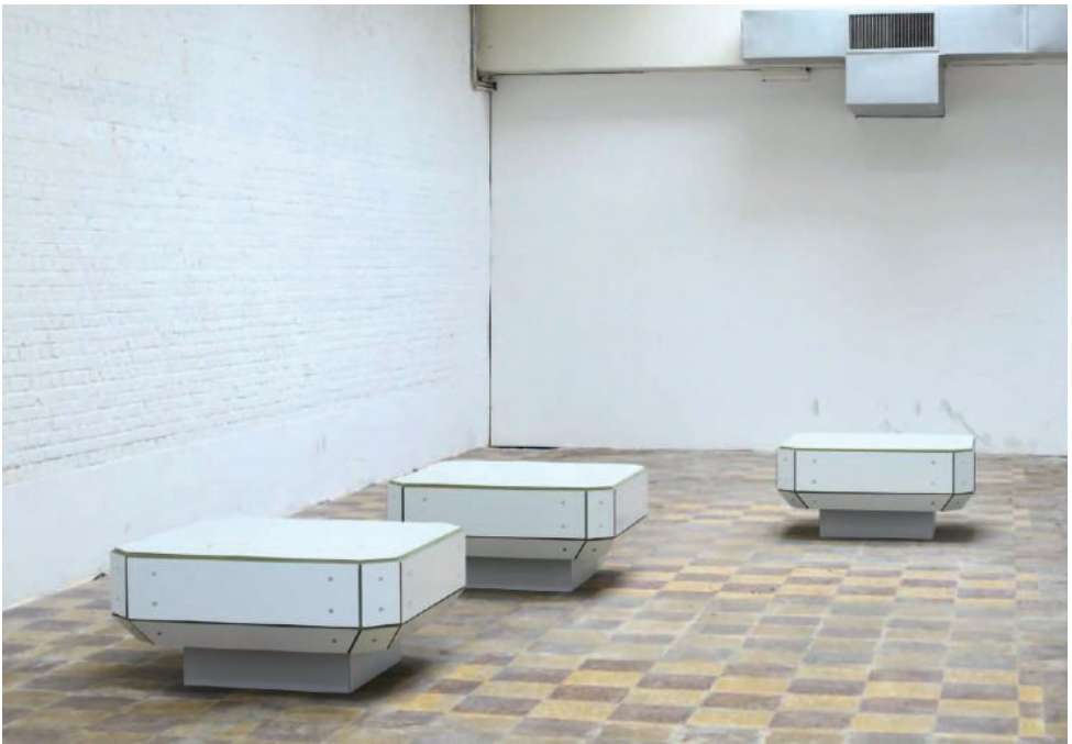
Alexander Gdanietz: Komisches Land (Kaufland) , 2025/26, Mixed Media, Ausstellungsansicht Antwerp Art weekend 2025 © Alexander Gdanietz