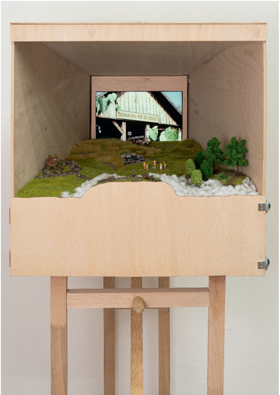
Antonia Alessia Virginia Beeskow: DÄMONEN, 2022, Diorama, Video, Binauraler Klang, Found Footage Material